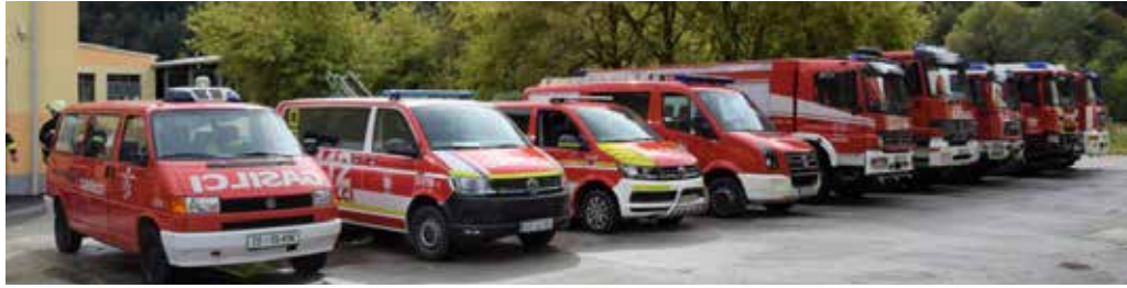
Vozni park naših društev

Delo na vaji je bilo razdeljeno v sektorje, naloge gasilcev pa so bile usmerjene v reševanje ujetih in pogrešanih oseb ter aktivno gašenje požara. Poleg zunanjih napadov, ki so se izvajali okrog celotnega objekta, so gasilci gasili tudi znotraj, kamor so vstopili s pomočjo izolirnih dihalnih aparatov. Na vaji so sodelovala vsa štiri društva iz občine, in sicer PGD Podsreda, PGD Kozje, PGD Lesično-Pilštanj-Zagorje in PGD