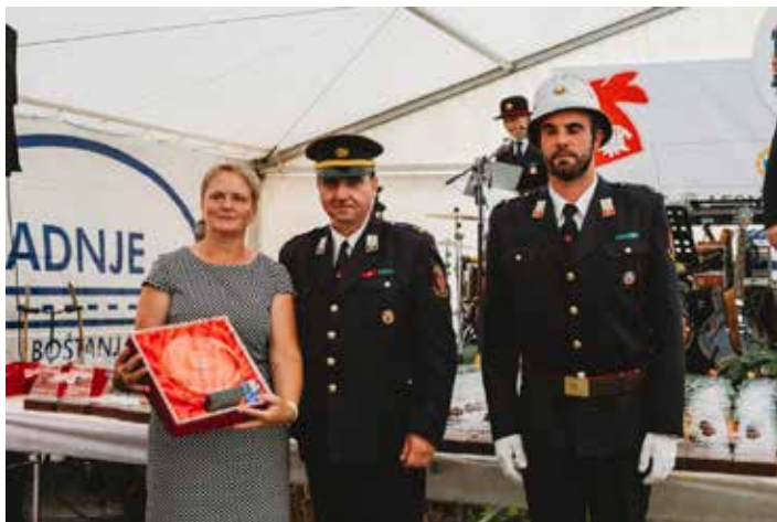
Gasilci so se županji zahvalili za prispevek občine