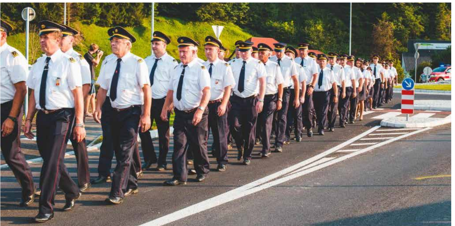
Mimohod 138 gasilk in gasilcev v paradi