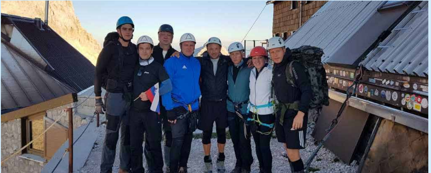
Pred pričetkom vzpona v četrtek zjutraj

Društvo Tenis klub Kozje v letu 2019 praznuje 20 let od uradne ustanovitve društva. V počastitev okrogle obletnice načrtujemo nekaj odmevnih aktivnosti. Prvo izmed njih smo izvedli v prvem tednu septembra, ko smo se podali na najvišjo slovensko goro in na njej prešali grozdje.