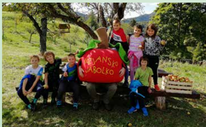
Učenci in učenke 3. razreda OŠ Lesično

Ves čas pa smo se družili z maskoto, s katero smo tekali okoli jablan in zabavno preživeli čas v čudoviti naravi.