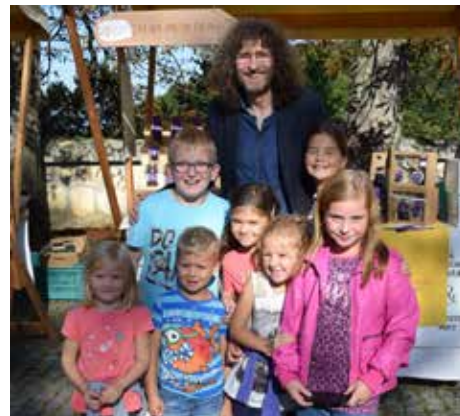
Otroci so se slikali z Adijem

Ob odlični hrani, rujni kapljici in polnih vrečah nakupljenih domačih, ekoloških produktov seveda sede tudi odlična, a hkrati sproščujoča glasba. In ravno za to je sinonim