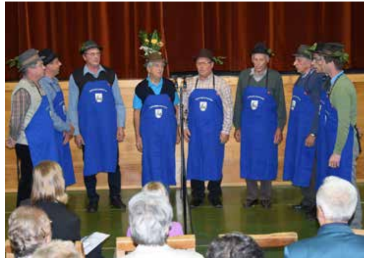
Domačini Pilštanjski gospodarji

Preostanek večera pa je pripadel petim skupinam, ki so vsaka izvedli dve skladbi. Kot prvi so se tako predstavili domačini, Pilštanjski gospodarji, ki že 24 let delujejo in ustvarjajo pod okriljem domače KD Lesično-Pilštanj. Tokrat so v Lesičnem zapeli dve pesmi, »Hladna jesen že prihaja« in hudomušno ljudsko pesem, ki govori o vasovalcu in nosi naslov »Ko sem k njej pršov«. Za Pilštanjskimi gospodarji so svoje glasove razodeli Ljudski pevci Bistrica ob Sotli, ki so sicer po stažu mlada skupina, a zvenijo kot, da bi prepevali že dolga leta. Tokrat so se predstavili s pesmima »Dekle, daj mi rože rdeče« in »Jaz pa grem; jaz pa grem«. Prvi dve skupini sta se več kot izkazali, kar je pričal tudi bučen aplavz. Iz Rogatca so v goste