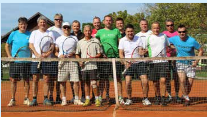
Vsi udeleženci turnirja

Tenis klub Kozje turnirje povabljenih dvojic organizira ob različnih priložnostih že od leta 2001 dalje. Letošnji je bil posvečen praznovanju