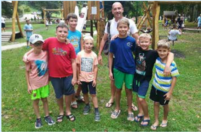
Karateisti so se udeležili karate kampa v Dobrni

Od 22. do 24. avgusta so se člani Karate kluba Kozjansko udeležili kampa na Dobrni v organizaciji Društva za karate Celje. Skupaj z ostalimi karate klubi Slovenije se nas je nabralo več kot 80. Kot vsako leto, so bili organizirani štirje karate treningi, kopanje in dnevne aktivnosti, tako da smo bili zasedeni čez ves dan. Uživali smo in verjamemo, da se bomo udeležili kampa tudi prihodnje leto.