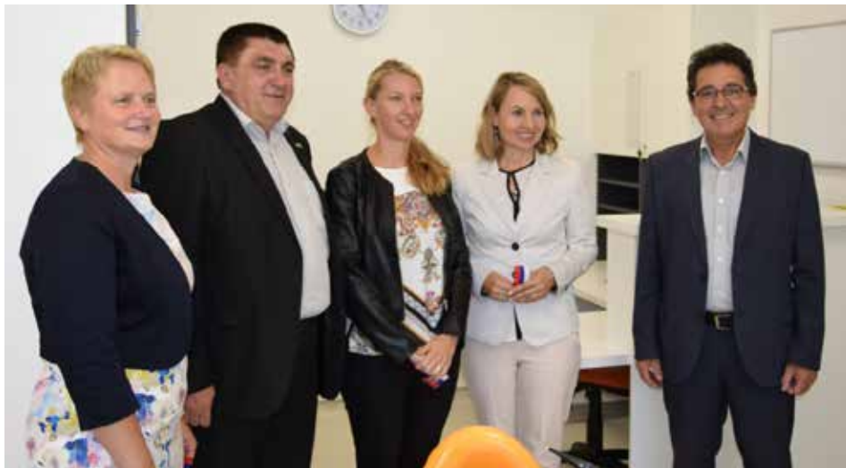
Vesetje ob novi pridobitvi

Občina Kozje in Javni zavod Zdravstveni dom Šmarje pri Jelšah sta s skupnimi moči prenovila zobno ambulanto v zdravstveni postaji Kozje. Prav tako so prenovili opleske sten, vhod v zdravstveno postajo, nova patronažna sestra pa bo svoje delo opravljala z novim službenim vozilom. Celotna investicija je stala okrog 90 tisoč evrov, pri čemer je delež Občine Kozje 35 tisoč evrov. Občina Kozje je prav tako uspešno kandidirala na razpisu in pridobila nepovratna sredstva v višini 55 tisoč evrov za novo reševalno vozilo, ki ga bodo v šmarskem zdravstvenem domu uradno predali namenu v oktobru.