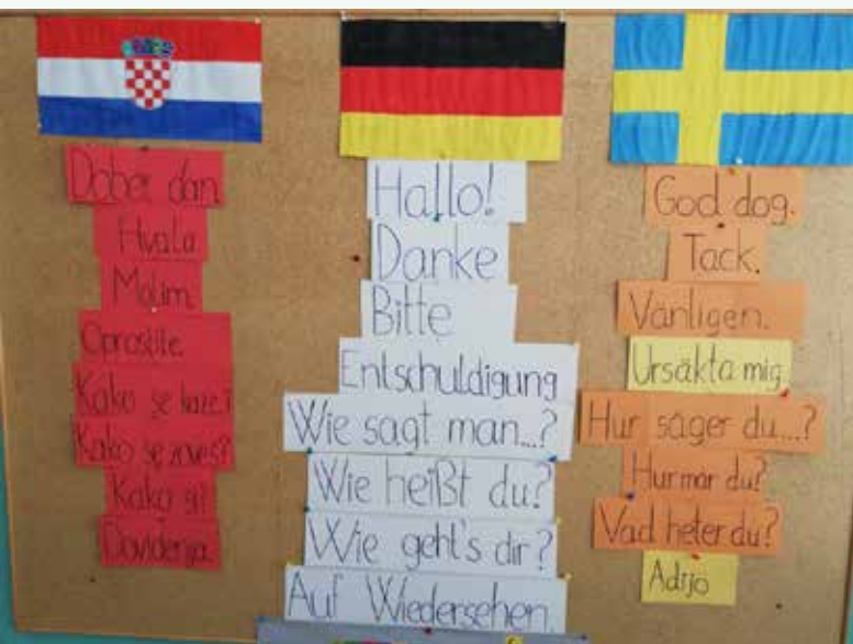
Tabla z besedami v različnih jezikih

26. septembra smo na OŠ Lesično obeležili evropski dan jezikov. Izdelovali smo evropske zastave, prevajali osnovne izraze v evropske jezike, se pogovarjali z naravno govorko angleščine, reševali kviz na temo dneva jezikov in se igrali z najdaljšimi besedami ter lomilci jezikov.