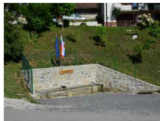
Korito je res lepo urejeno