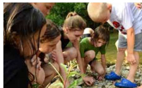
Udeleženci med aktivnostjo

Mentorji Kozjanskega parka vsako leto poskrbijo za bogat nabor aktivnosti, ki je otrokom všeč, hkrati pa je poučen in v marsikom zbudi še dodatno željo po skrbi za naravo. Tudi letošnja prva termina sta bila obarvana s številnimi aktivnostmi, ki so bile mladim v užitek, od njih pa niso odnesli le to, da jim hitreje mine počitniški čas, temveč tudi mnoga nova znanja, ki jim bodo prav prišla tako v šoli kot tudi v življenju nasploh. Med drugim so udeleženci, 48 jih je bilo v prvih dveh terminih, opazovali ptičja čebelarja v peskokopu Župjek na Bizeljskem, spoznavali pester svet metuljev, kobilic in rastlinskega sveta na travnikih na pobočjih Veternika. Mladina je pokazala tudi svoje sposobnosti ročnega dela; izdelali so gnezdilnico za smrdokavro in velikega skovika, zašili lastne torbice, risali skupinske risbe, spoznavali vodne organizme v reki Bistrici in v potoku Gruska. Prav tako so se tudi letos podali na iskanje zaklada, ki je bil tokrat skrit