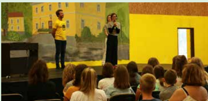
Producentka in voditeljka Malih sivih celic

Na začetku preteklega šolskega leta se je ekipa učencev Osnovne šole Kozje izkazala in zmagala na predtekmovanju za TV kviz Male sive celice za dolenjsko regijo. To je med drugim pomenilo, da je OŠ Kozje postala gostiteljica naslednjega predtekmovanja v šolskem letu 2019/2020.