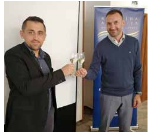
Novi in stari predsednik

Predstavnice Razvojne agencije Sotla so pripravile pregled dela do meseca septembra. Na območju LAS se je do Skupščine zaključilo pet operacij, in sicer ena sofinancirana iz sklada ESRR in štiri iz sklada EKSRP. Območje je s tem med drugim pridobilo: prvi skate park, namenjen ekstremnemu rolanju, rolkanju in spretnostnemu kolesarjenju; stranski dostop v Športno dvorano Rogaška Slatina z zunanjo invalidsko klančino; polnilno postajo za električne avtomobile; urejeno postajališče za avtodome (vse na območju občine Rogaška Slatina), fitness na prostem za športno aktivne v občinah Šmarje pri Jelšah ter Podčetrtek ter urejeno učilnico na prostem in tematsko Emينو pot na območju Občine Podčetrtek. LAS pa je uspešen tudi z izvajanjem aktivnosti v okviru dveh operacij sodelova-