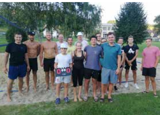
Udeleženci turnirja v odbojki

Naša tradicionalna prireditev Gremo za Bistr'co VI. se je letos odvijala kar dva dneva. Sobotni večer smo preživeli ob dobri glasbi in tabornem ognju, na katerem smo pekli koruzo. Odigrali smo tudi prijateljske igre beer ponga. V nedeljo, 18. avgusta, se je dogajanje prestavilo na mivko, kjer se je v odbojki pomerilo sedem ekip, ki so bile iz Kozjega, Bistrice ob Sotli, Imenega in celo iz Brežic. Vreme je bilo sončno in gledalci so lahko uživali ob zanimivih in borbenih setih. Na koncu so zaslužno zmagali fantje iz ŠD Globoko , sledila jim je ekipa ŠD Koz-