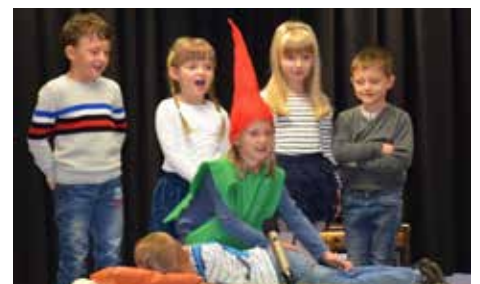
Nastopili so tudi otroci iz vrtca