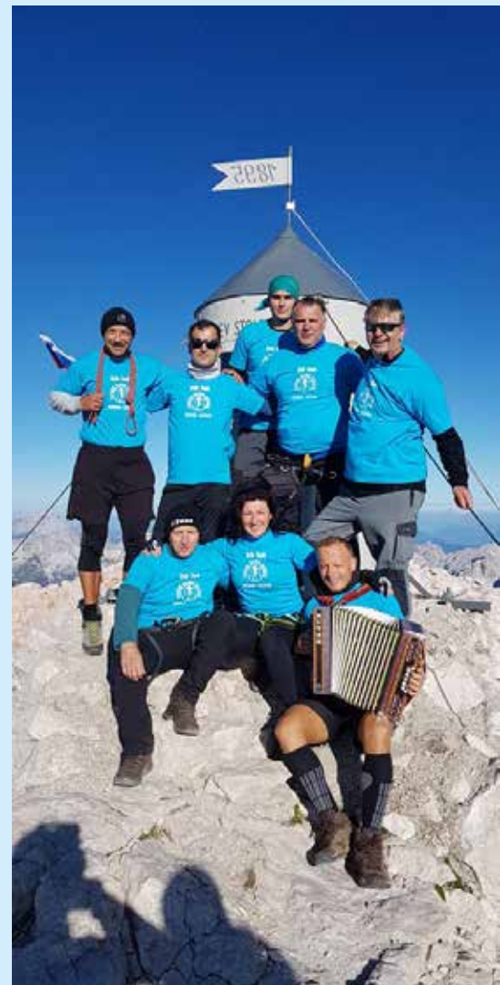
Odprava TK Kozje pri Aljaževem stolpu