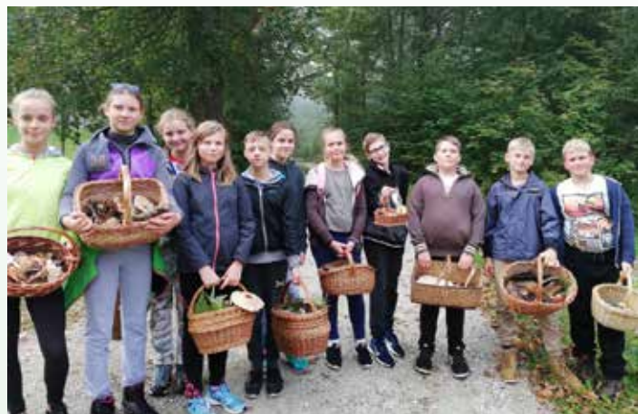
Nabrali smo veliko različnih gob

Razstavili smo blizu sedemdeset vrst gob. Prevladovala so užitne, našla pa se je tudi kakšna strupena.