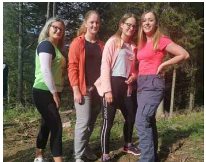
Pripravnice PGD Buče

Minulo soboto je na Kopah potekalo državno tekmovanje gasilk in gasilcev v gasilski orientaciji. Gre za gasilsko disciplino, kjer se ekipe treh članov pomerijo v gasilskih spretnostih in znanjih na progi, hkrati pa morajo na terenu poiskati točke oziroma se orientirati s pomočjo zemljevida in kompasa. Tako mladi gasilci med drugim izvajajo vajo z vedrovko, postavitvev orodja, zvijanje cevi,