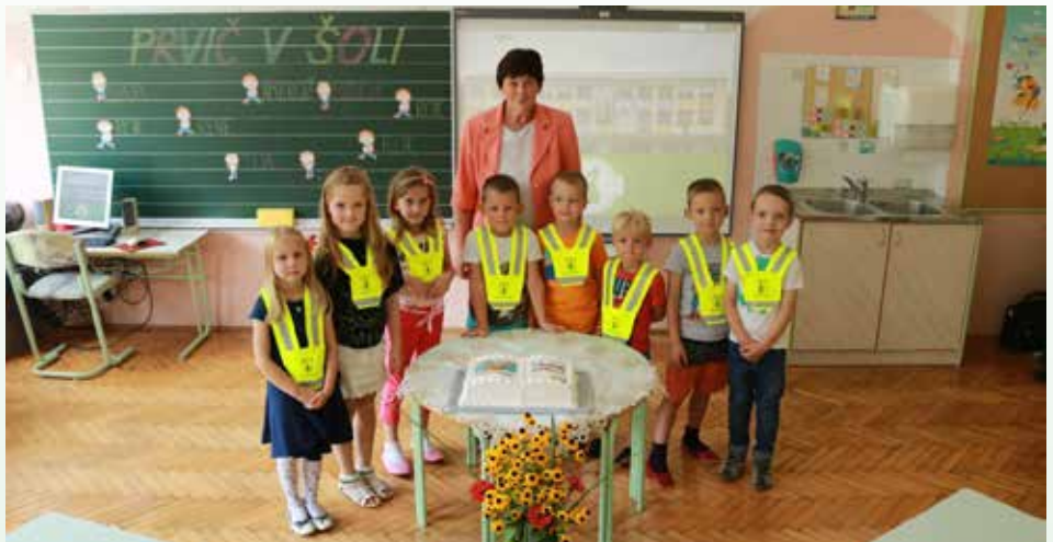
Prvošolčki z razredničarko