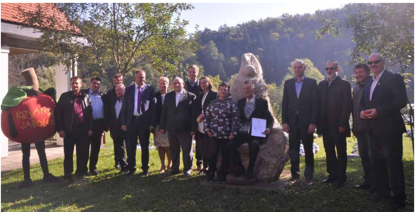
Ustoličili so novega carjeviča

Zdenka Ivačič