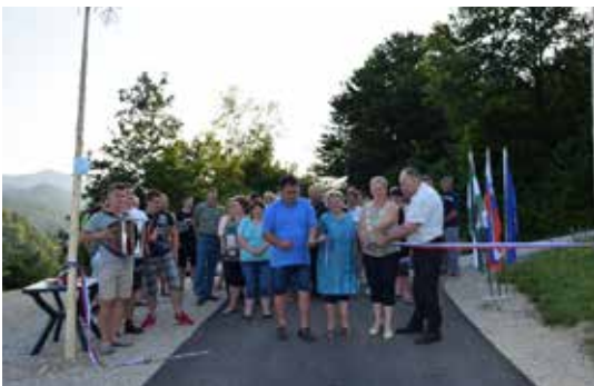
Svečani prerez traku