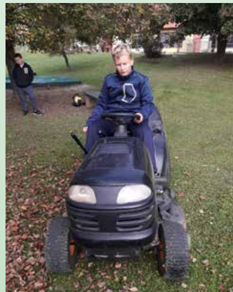
Veliko se jih je poskusilo v vlogi hišnika