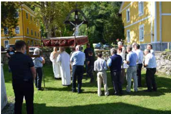
Procesija okrog cerkve

Praznik Marije Device oziroma Marijino vnebovzetje sodi med največje Marijine praznike. Pri nas je Mariji posvečenih veliko župnijskih in podružničnih cerkva in kapelic, kar priča o tem, kako globoko zakoreninjeno je Marijino vnebovzetje v našem verskem izročilu. Ob Marijinem vnebovzetju farni praznik praznujejo tudi v Kozjem, kjer so se tudi tokrat številni domačini in krajanje okoliških krajev zbrali na slovesni sveti maši.