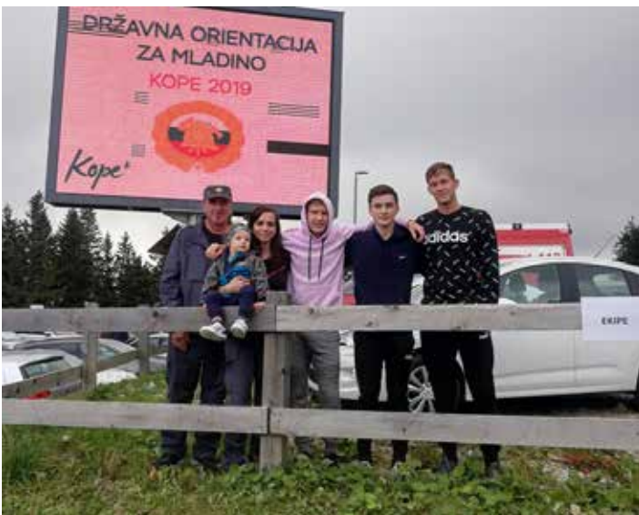
Mladinci PGD Lesično-Pilštanj-Zagorje

Minulo soboto je na Kopah potekalo državno tekmovanje gasilk in gasilcev v gasilski orientaciji. Gre za gasilsko disciplino, kjer se ekipe treh članov pomerijo v gasilskih spretnostih in znanjih na progi, hkrati pa morajo na terenu poiskati točke oziroma se orientirati s pomočjo zemljevida in kompasa. Tako mladi gasilci med drugim izvajajo vajo z vedrovko, postavitvev orodja, zvijanje cevi,