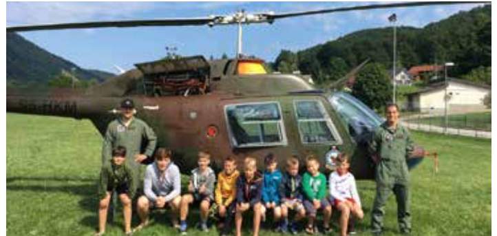
Obisk vojske na enem od terminov

Kot je že v navadi, so otroci svoje počitnice v Kozjem začeli s prihodom v nedeljo. Letos je potekal že 11. Poletni tabor Kozje, kjer so v rekordnih, šestih terminih (od 30. junija do 26. julija in od 4. avgusta do 16. avgusta) gostili okoli 240 otrok iz celotne Slovenije. Ob bok nogometnemu, košarkarskemu, likovnemu, teniškemu in šahovskemu taboru so letos priključili še plesni tabor, na katerem je v dveh terminih plesalo okrog 30 otrok. Ob treningih, ustvarjanju in plesu otroci obiskujejo razne delavnice, tekmujejo v športnih in kmečkih igrah, igrajo namizne igre in ročni nogomet. Na sporedu so sprehodi po poti na stari grad v Kozjem, zvečer pečejo hrenovke ob tabornem ognju in imajo karaoke. Enkrat v tednu za vsak termin pripravijo še kopalni dan v Aqualuni, obiščejo čokoladnico in se posladkajo na Jelenovem grebenu. Vsak termin otroke obišče tudi Zobni Peter, kjer predstavi, kako je pomembno skrbeti za svoje zobke. V drugem terminu je v sredo, 10. julija, v dopoldanskem času tabornike obiskala skupina za promocijo vojskovanja iz 72. Brigade NM. Tabornikom so pokazali prikaz oborožitve in opreme, ki jo vojak uporablja pri svojem delu. Uprava za obrambo NM je skozi naloge, ki so jih otroci opravljali (premagovanje ovir, skrb vojaka za opremo, red, disciplino, maskiranje in zlaganje srajc) predstavila njihovo delo, ki je postalo njihova rutina. Iz vojašnice Jerneja Molana so prišli na obisk z vojaškim helikopterjem Bell